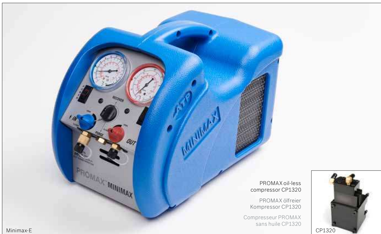
PROMAX oil-less compressor CP1320